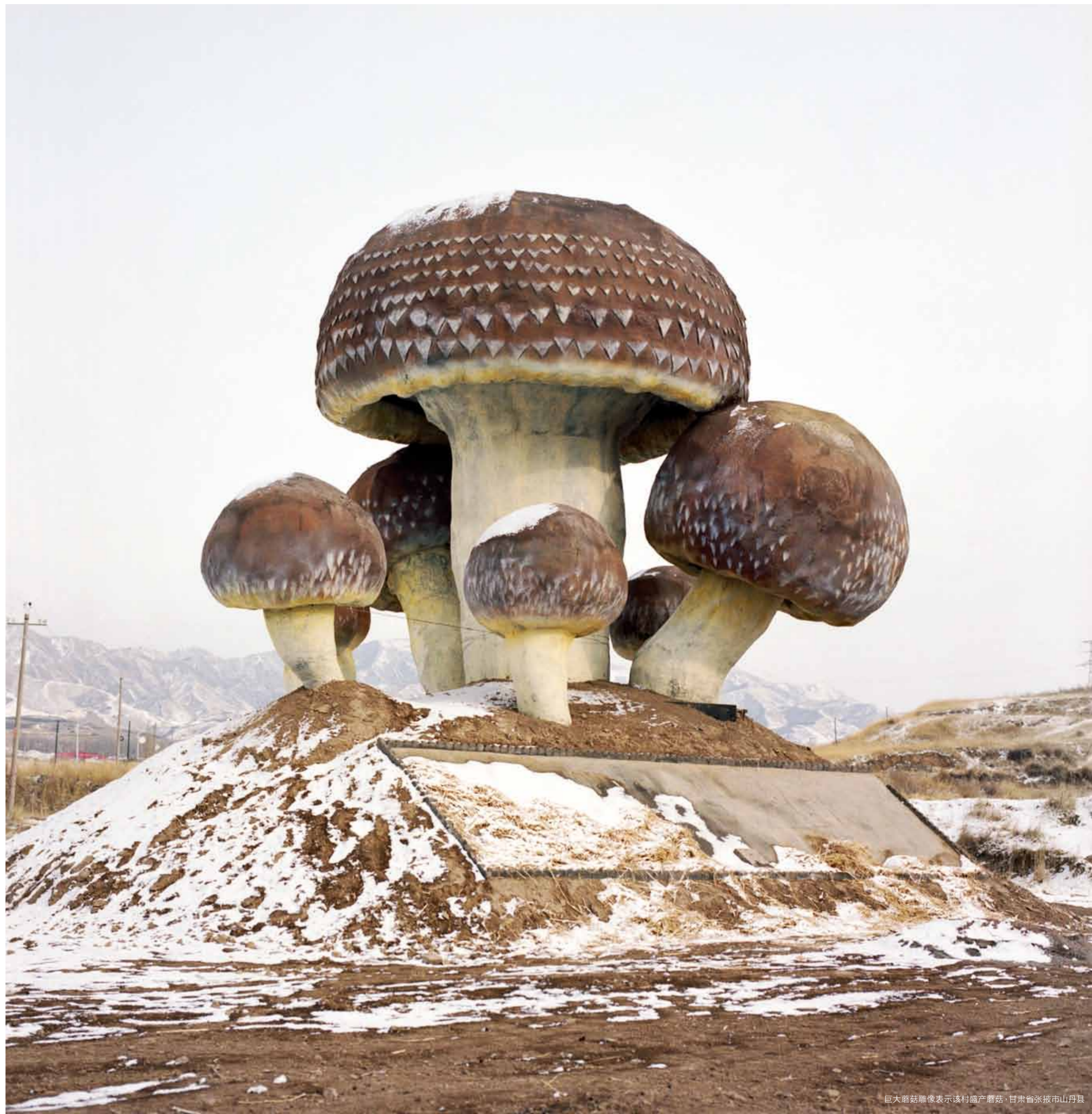
巨大蘑菇雕像表示该村盛产蘑菇，甘肃省张掖市山丹县

长城横跨甘肃省境东、中、西三大地域，分布在11个市州，所处地貌主要有黄土高原的沟壑崩梁、戈壁滩和沙漠等，总长度为3654千米，居全国第二。其中明长城1738千米，长度为全国之首。长城墙体材质以土墙为主，石墙较少，还有壕堑、烽燧、关堡、山水险等其他遗存，形成了一个较为完整的综合性军事防御体系。甘肃长城的构筑方式以黄土夯筑为主，因地制宜，就地取材，部分地段使用红柳、芦苇、胡杨、土坯、石块等砌筑、垒筑、叠筑、堆筑或混筑，部分地段以山水为屏障，充分体现了甘肃的地方特色。