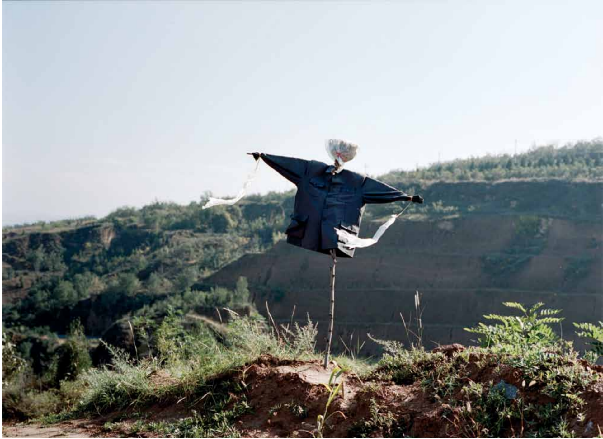
山西忻州市河曲县黄河岸边的一个稻草人