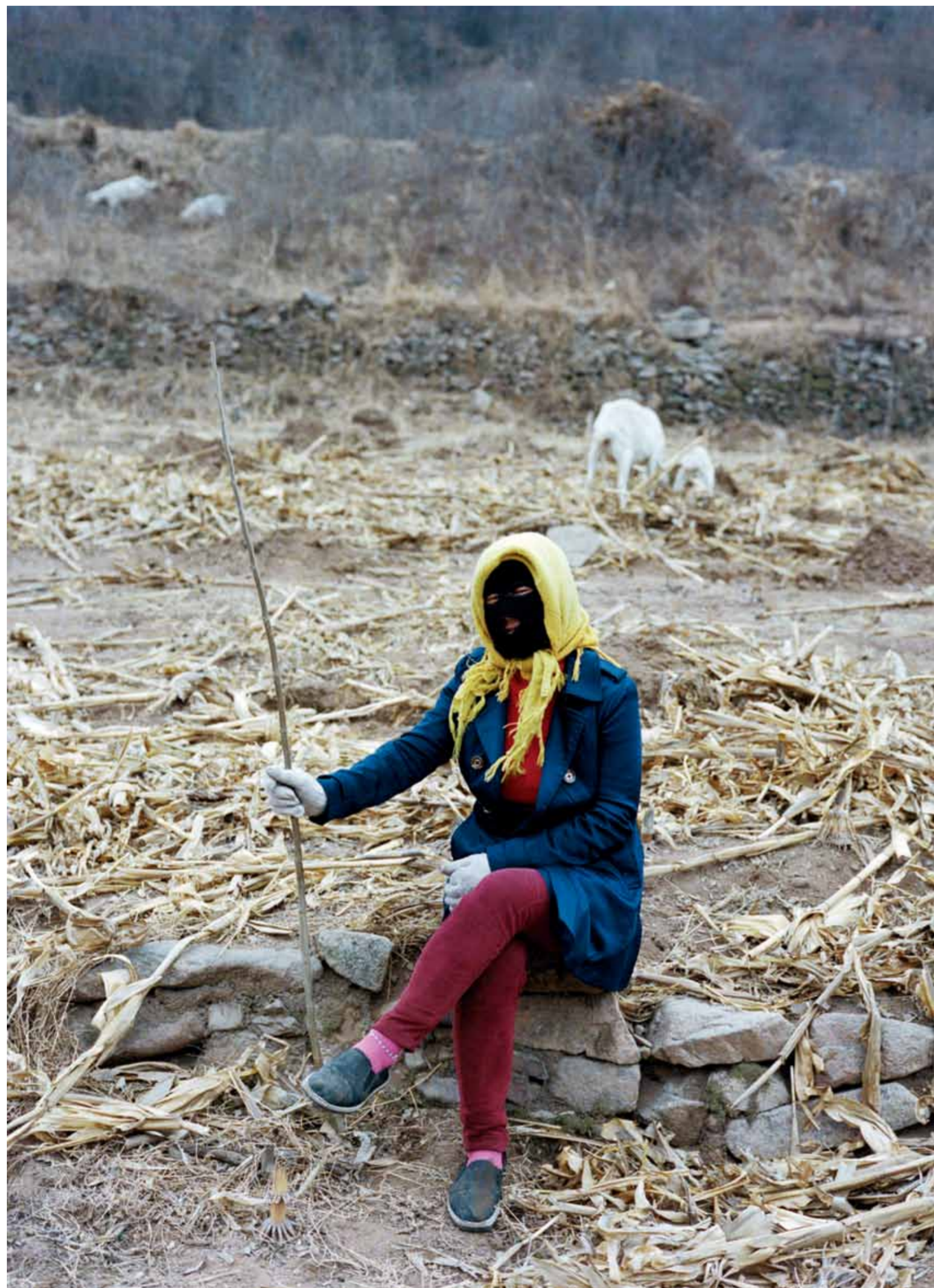
一位放羊的阿姨·河北抚宁县董家口