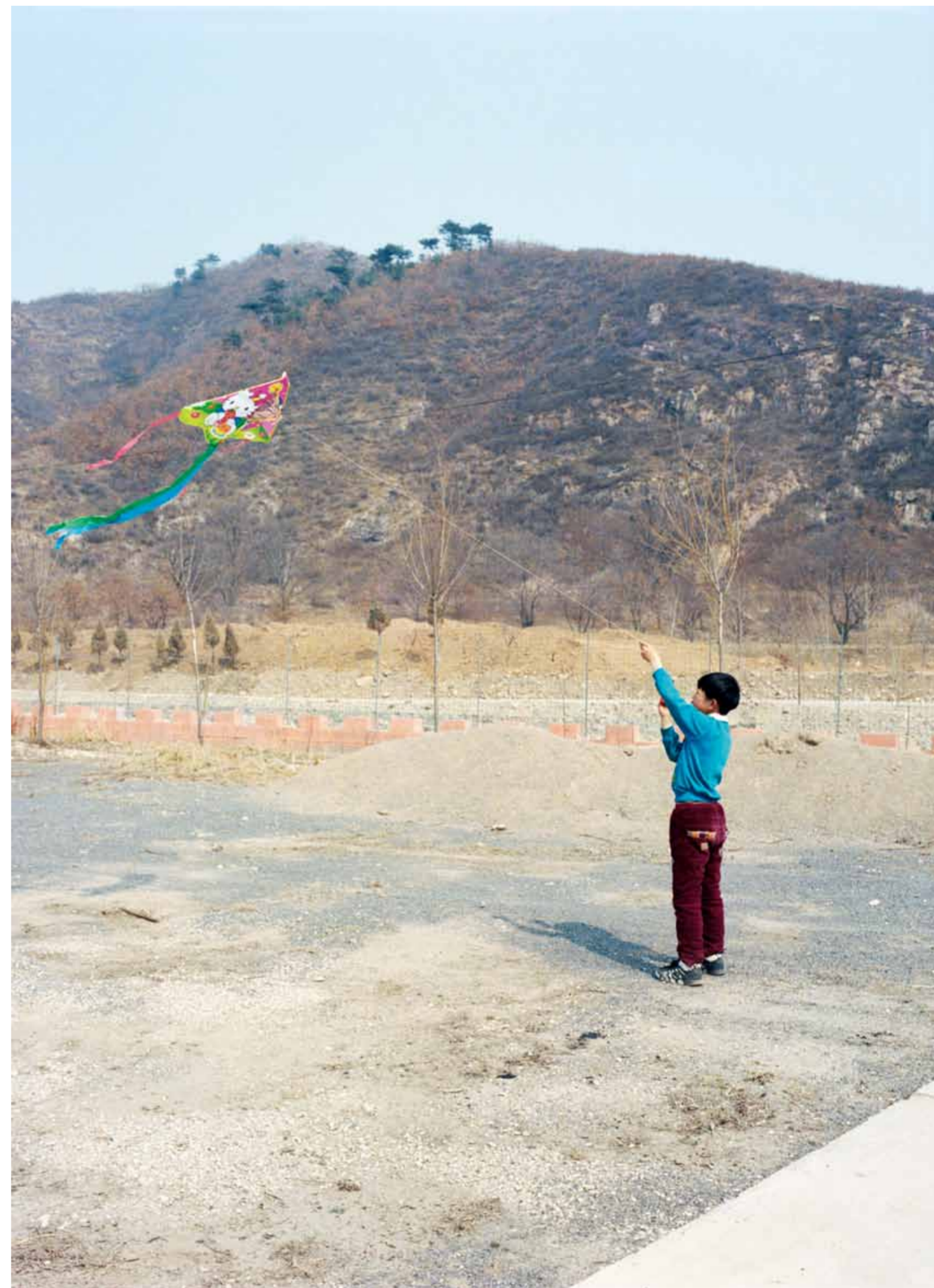
放Hello Kitty风筝的小男孩·秦皇岛驻操营镇城子峪村