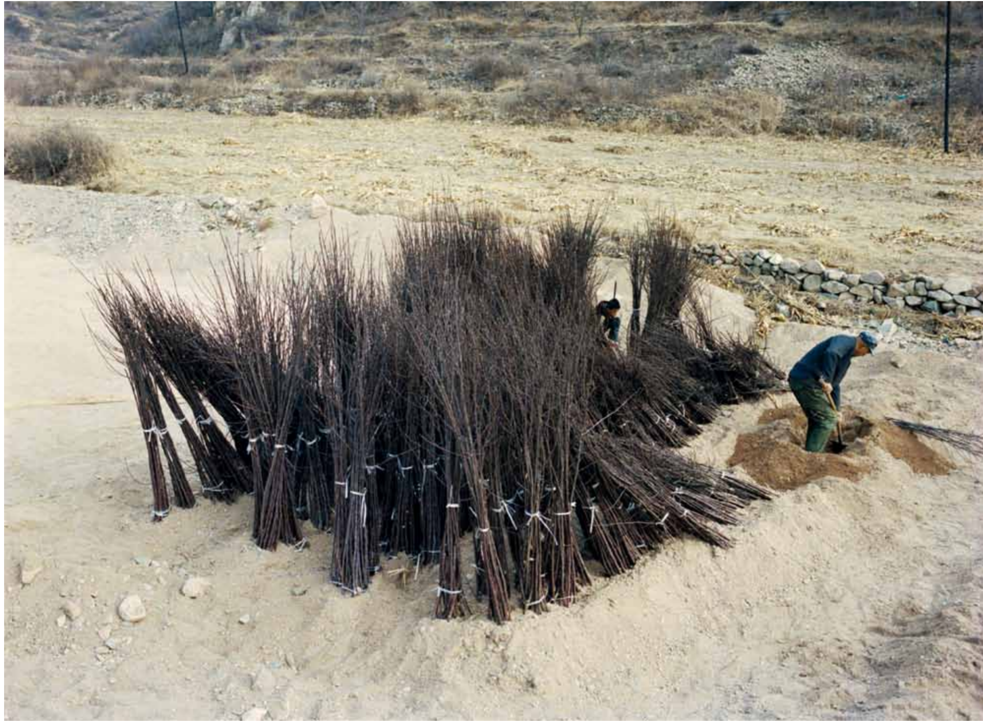
一位干农活的老爷爷·河北抚宁县庙山口