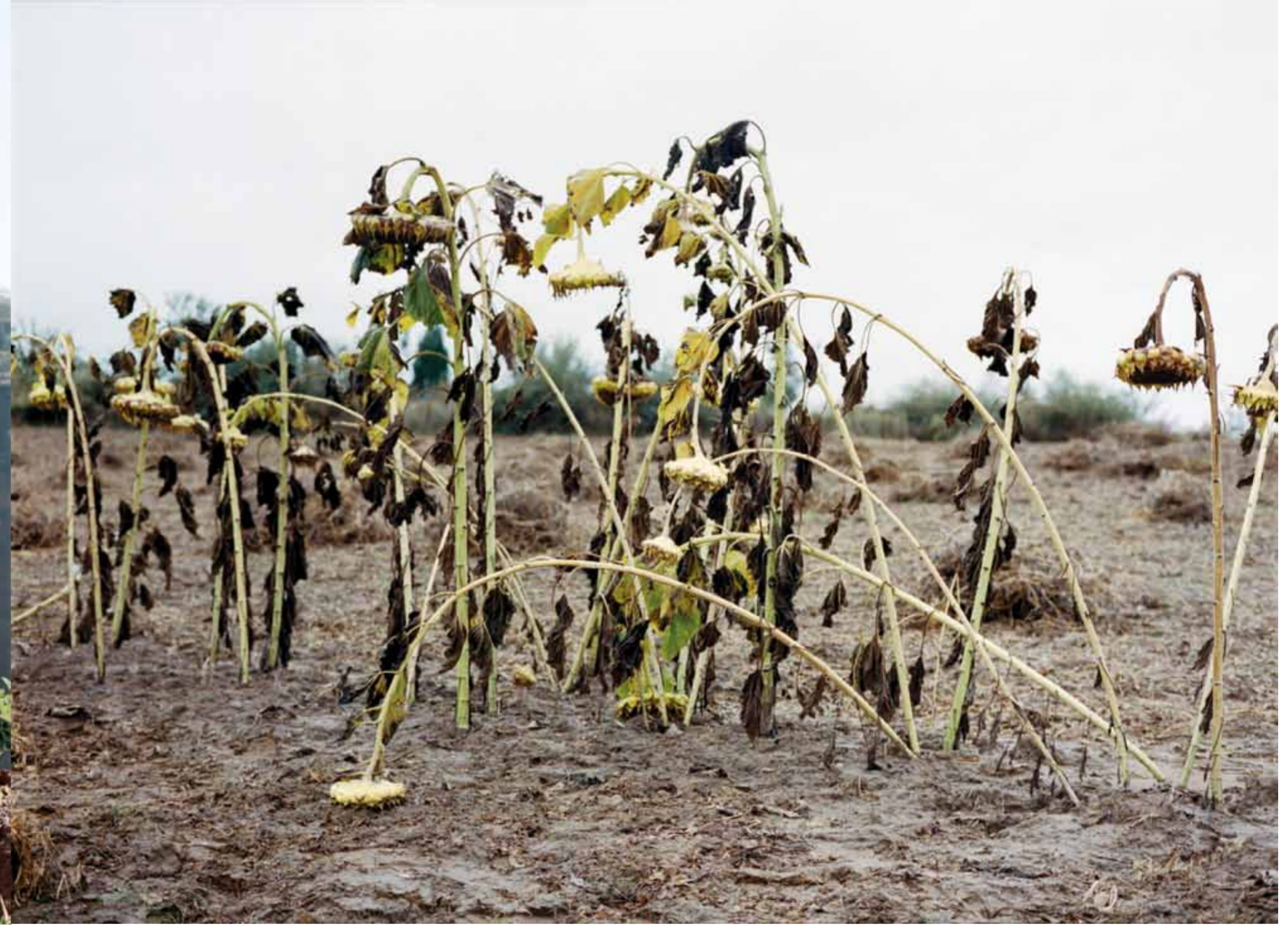
去山西省河曲县娘娘滩路上遇见的一片向日葵田