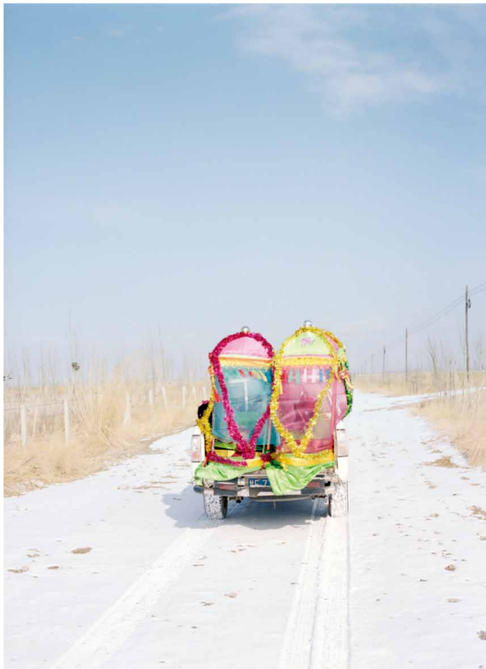
春节社火结束的时候，一辆拖拉机拉着两条道具船在回家的路上，甘肃省嘉峪关市新城镇观蒲村