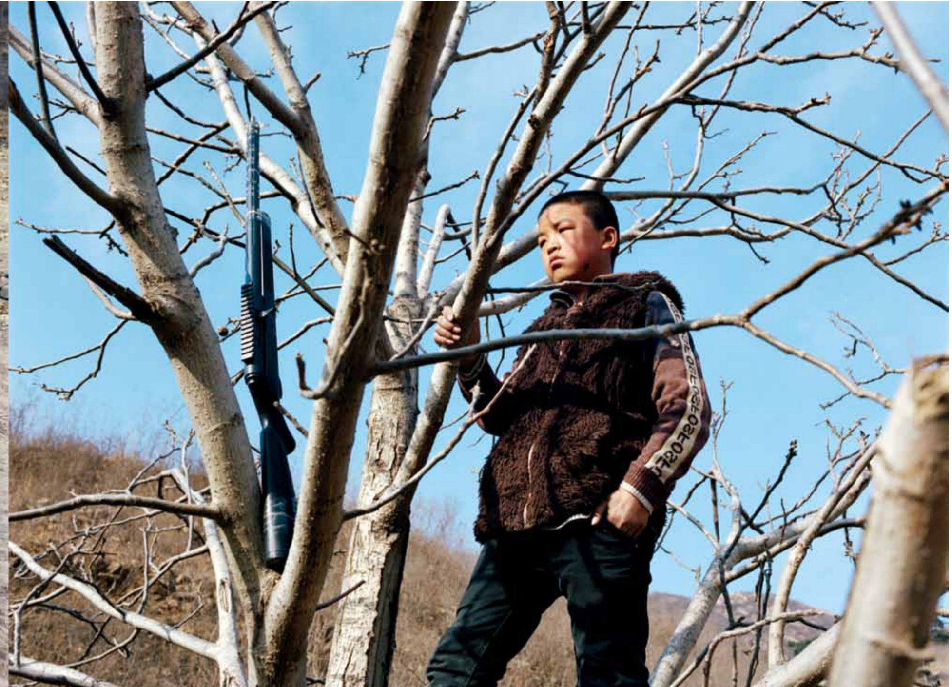
一个拿着玩具抢玩耍的小男孩·河北抚宁县庙山口