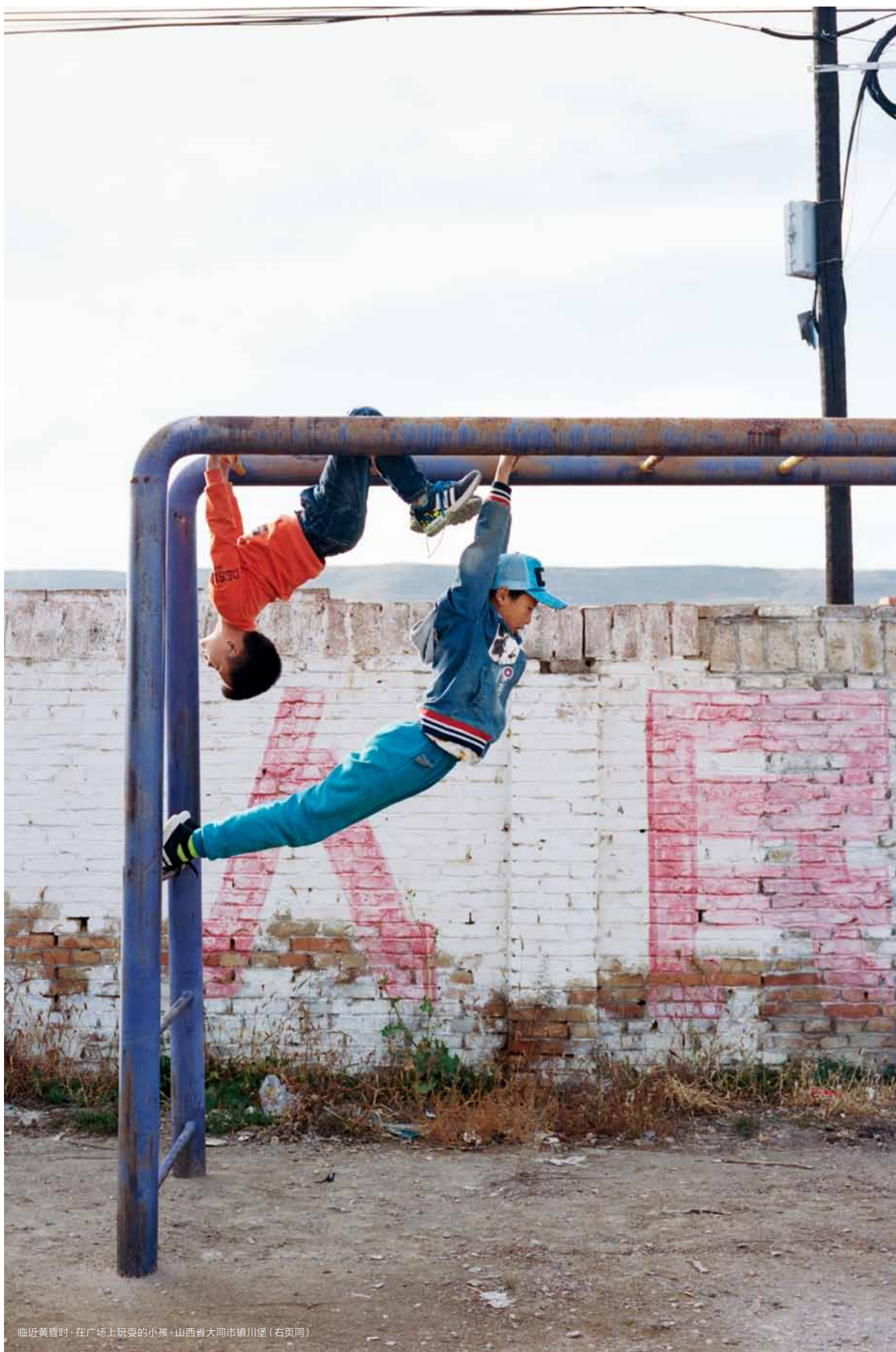
临近黄昏时，在广场上玩耍的小孩·山西省大同市镇川堡（右页同）