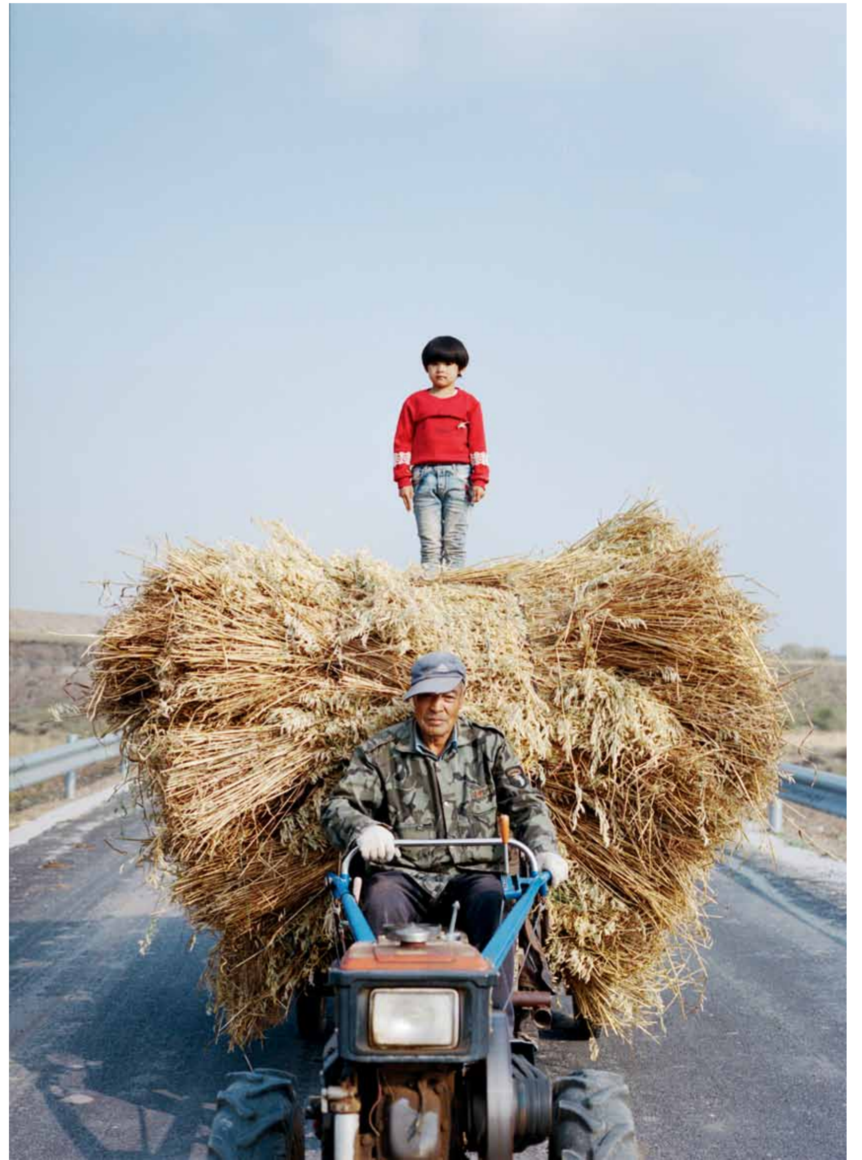
爷俩儿秋收完正要回家·山西省左云县八台子村

大边长城全长约600公里，基本上沿毛乌素沙漠南缘分布，全线墙体均为黄土夯筑，现存高度一般为2~3米，最高达5米，其中的相当一部分已被沙漠淹埋，地表呈现出断续隆起的沙垄。二边长城修筑于大边内侧数公里至40公里一线的山区地带。走向略与大边平行。其构筑方式基本为“依山凿削”，堑山成障，保存情况较差。在大边与二边之间或两边线上，存有屯兵的城堡30余座和烽火台多处。